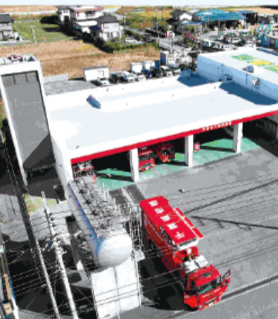
笹原工務店 八幡消防署外壁・屋上防水改修工事