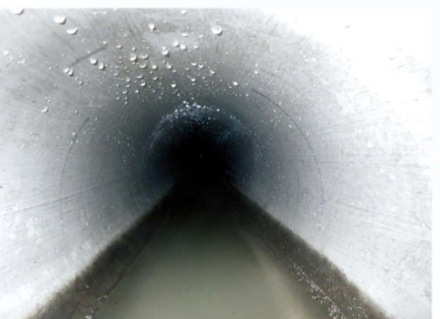
山内工業 牛久ニュータウン汚水管渠更生(2-2)工事(ゼロ債務)