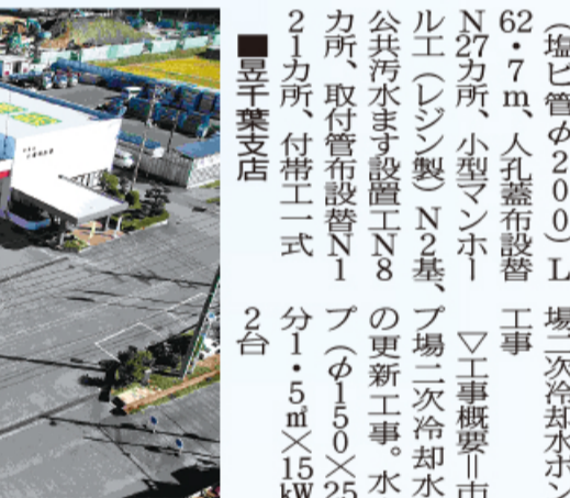
山内工業 牛久ニュータウン汚水管渠更生(2-2)工事(ゼロ債務)