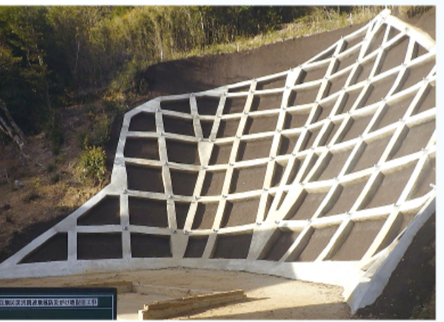
新千葉建設 奈良地区災害関連地域防災がけ地復旧工事

■クボタ東京本社 ▽工事名 吹上中継ポンプ場・前川中継ポンプ場・雨沢・五井ポンプ場・市原ポンプ場・岩崎ポンプ場・今津ポンプ場