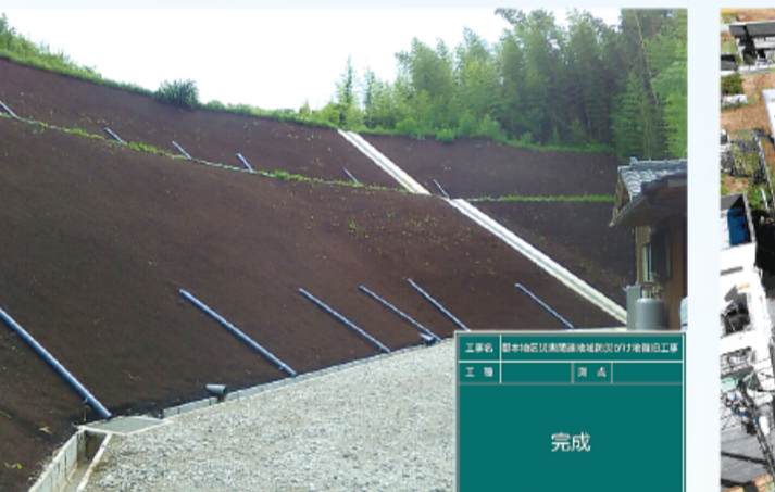
進和建設 郡本地区災害関連地域防災がけ地復旧工事